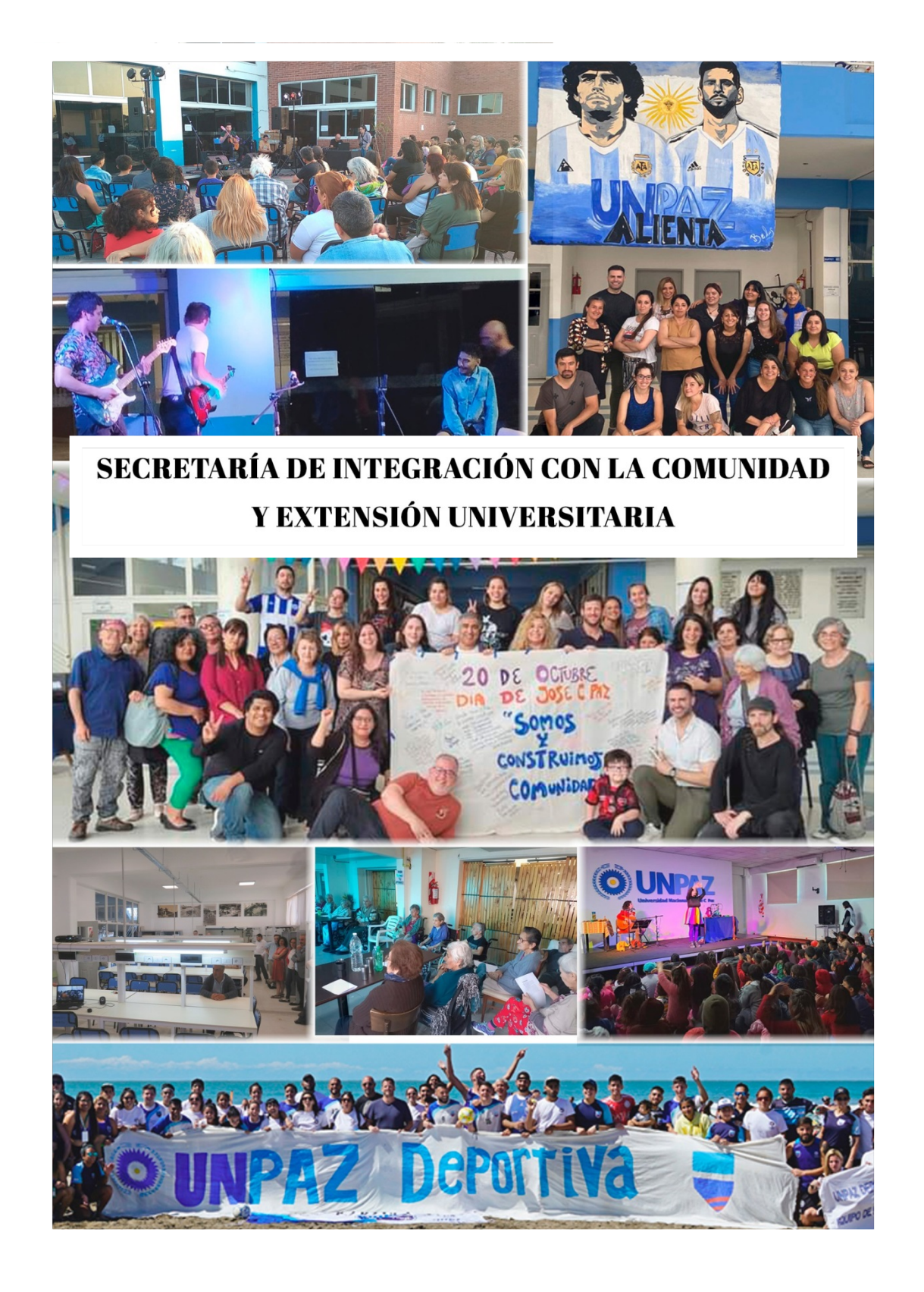
Imagen correspondiente a la Tapa: